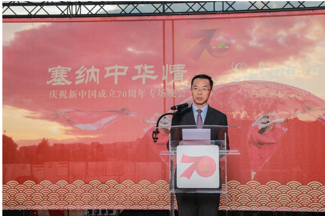
Lu Shaye, Chinese ambassador to France, speaks at the opening ceremony.

There were also over 150 guests from the French government, cultural circles, as well as other international organizations and delegations in Paris.