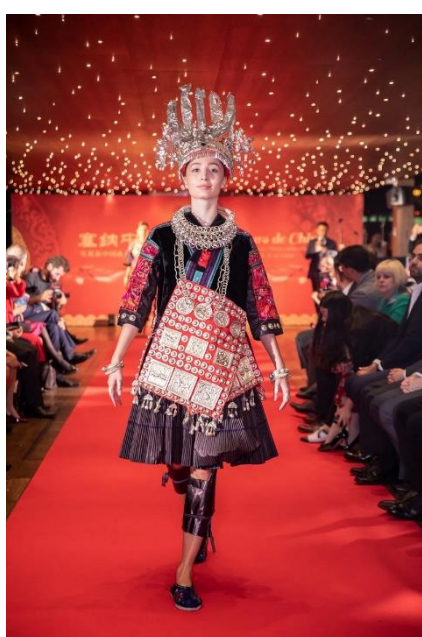
A model walks on the runway with Chinese ethnic attire.

The gala also featured the diverse cultures of China's ethnic groups as well as the traditional artistic forms. With food and wine, delicate art styles and gorgeous outfits, it was an unforgettable Chinese evening for everyone.