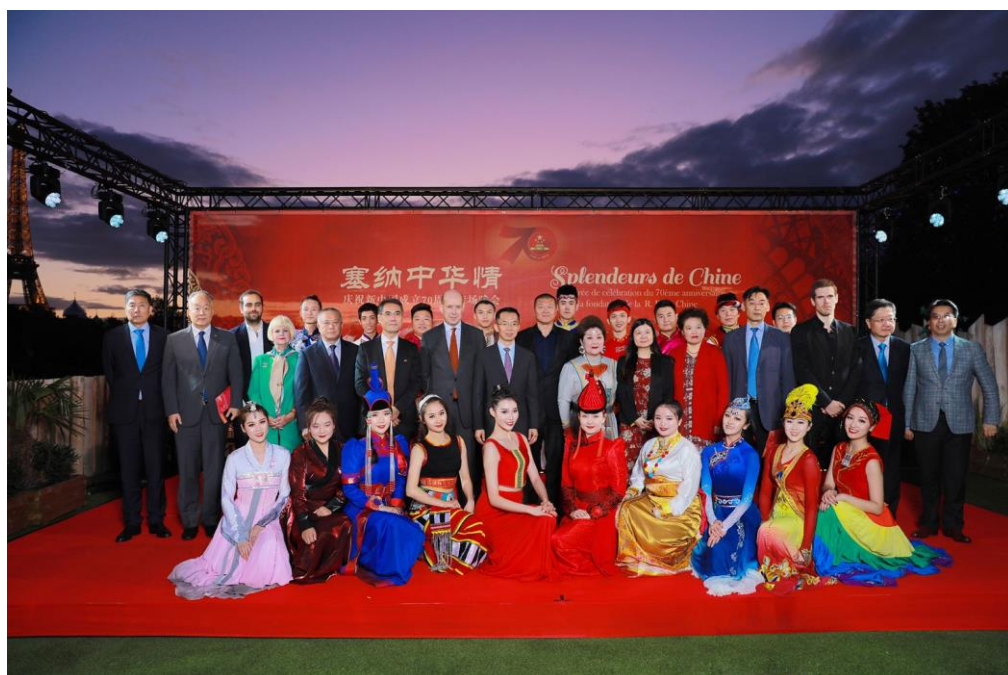
主要嘉宾同中央民族大学民族艺术团演员合影留念

晚会以在船坞举行的“锦绣中华”中央民族大学民族艺术团的演出拉开帷幕，气势磅礴的蒙古族群舞《奔腾》、婀娜多姿的维吾尔族女子群舞《石榴花开》、马头琴等民族乐器奏响的浪漫法国乐曲《玫瑰人生》、蒙古族、藏族、鄂温克族等民族的歌曲和欢腾壮美的中国各民族群舞《锦绣中华》精彩纷呈，展现了中国民族融合、蓬勃发展的繁荣景象，深深感染了现场观众。