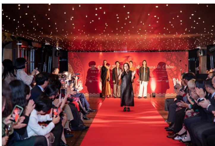
Fashion show at the gala.

The event on the cruise comprised artistic performances, a photo exhibition, a fashion show for ethnic attire and Chinese cuisine, giving French citizens a better understanding of Chinese culture.